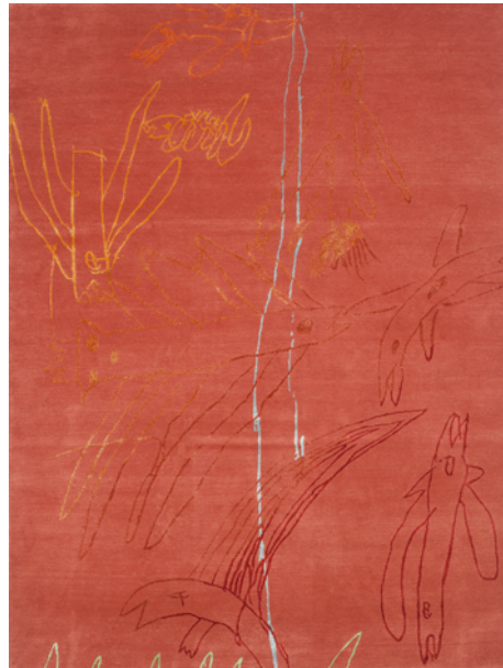
Kinderzeichnung „Minimonster“ Kolja