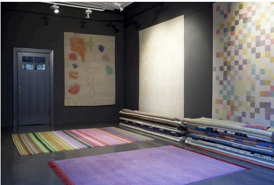
REUBER HENNING Showroom Berlin